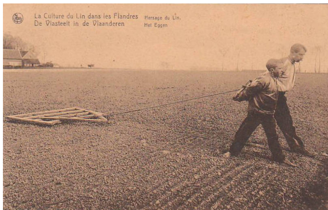
Vlaamse arbeidsethos, geheel volgens de vereisten van het mondiaal patronaat

De globalisering dwong en dwingt de samenlevingen meer en meer op elkaar gaan te gelijken en die samenlevingen reageren daar soms op door meer van elkaar te willen verschillen. Maar - paradoxaal genoeg - hoe meer verschillend ze willen zijn, hoe gelijkender ze worden. Want er bestaat een reeks Westerse standaardmanieren om uniciteit en verschil uit te drukken, die door de mainstream (dus liberale) sociale wetenschappen “universeel” aanvaard gemaakt zijn, waardoor men volkeren gemakkelijker zou kunnen vergelijken. De “grammatica” waaruit geput wordt om verschillen uit te drukken is zo goed als ‘globaal’ gestandaardiseerd, zodat in het proces om zichzelf vergelijkbaar en herkenbaar te maken, het zoekend volk die echte trekken verliest die het oorspronkelijk als volk onderscheiden maakten. Steeds weer wordt dan de oppervlakkige folklore erbij getrokken: klederdracht, keuken, volksmuziek, etc. Of ook, zoals te zeer bij ons, het type van arbeidsethos, publieke cultuur en goed bestuur, geheel volgens de vereisten van het mondiaal patronaat.