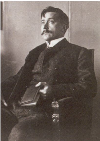
Maurice Maeterlinck: product van de Franstalige burgerij in Gent. Groot dichter, maar vreselijk elitair.