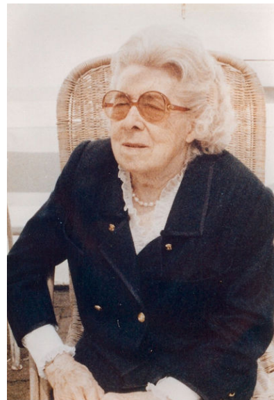
Suzanne Lilar: product van de Franstalige burgerij in Gent. Getalenteerd schrijfster met een open geest.