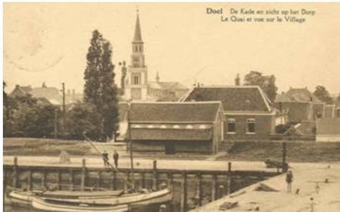
Doel: schitterend dorp in betere tijden

verkeersinfarcten zullen gevolgen hebben tot voorbij Zwijndrecht. Het is maar de vraag of Antwerpen dat soort 'prestige' wel kan gebruiken en of dat soort 'prestige' de moord op een dorp kan verantwoorden. Economisch prestige is waar het ook om draait in de zaak Doel. Het Saefthinghedok zou het symbool van de groei van de Vlaamse economie moeten zijn. Dat wil zeggen, het Vlaanderen van het ultrakapitalisme, het Vlaanderen van VOKA, VBO, UNIZO, het Vlaanderen van CD&V en VLD (de grootste voorvechters van het dok), het Vlaanderen dat perfect past binnen het maatschappelijk model dat ons wordt opgedrongen door de EU en soortgelijke machines van het neoliberalisme. De Antwerpse haven is daarbij 'ground zero', daar wordt de asociale politiek van de toekomst uitgestippeld en uitgetest, zonder scrupules en zonder enig respect voor stad of platteland. Maar als niet wordt opgetreden tegen deze ontwikkelingen, tegen datgene waar Doel en de Lange Wapper slechts de symptomen van zijn, riskeren we dat Vlaanderen één groot 'Doel'- en 'Lange Wapper'-dossier gaat worden. Het is dan ook de taak van de Vlaamse beweging én de sociale beweging om nu reeds die strijd aan te gaan voor een leefbaar Vlaanderen.