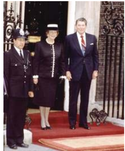
Thatcher en Reagan maakten van de deregulering hun levenswerk

De financiële crisis is een probleem van hebzuchtige bankiers, managers en speculanten maar vooral een politiek probleem, omdat het wettelijke kader dat de crisis mogelijk maakte, werd gecreëerd door de politiek, vanaf de jaren tachtig van vorige eeuw (sedert president Ronald Reagan in de VSA en Margeret Thatcher in GB).