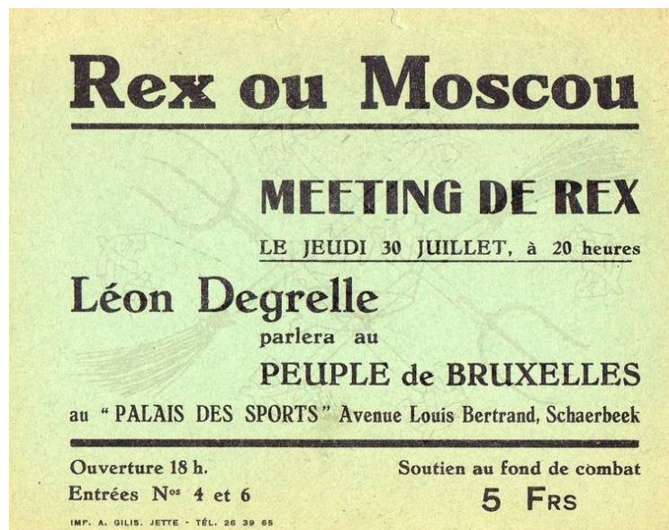
Een historisch volksfiguur richtte zich tot het Volk van Brussel