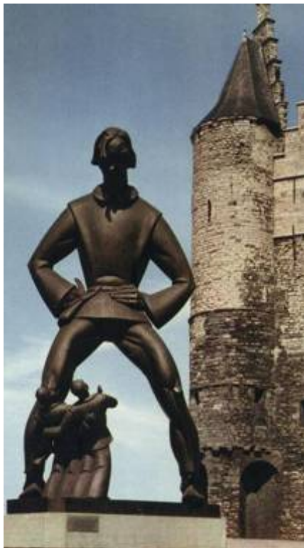
Lange Wapper zaait angst in Antwerpen

De voorbije maanden heeft de Vlaamse politiek zich meermaals de tanden stuk gebeten op het dossier van de 'Oosterweelverbinding', die de ring rond Antwerpen zou moeten sluiten en de verkeerssituatie verbeteren. Vooral de 'Lange Wapperbrug' wordt zwaar onder vuur genomen en twee burgerbewegingen, Ademloos en Straten-Generaal, voeren een intensieve campagne tegen deze brug. Dankzij hun werk is al een en ander aan het licht gekomen over de schandalige manier waarop er over dit project werd 'gecommuniceerd'. Het geval 'Slangen' is daarbij niet meer dan de top van de ijsberg. De hele geschiedenis van de Oosterweelverbinding en de Lange Wapperbrug, alsook alle argumenten tegen die brug, kan je vinden op de webstek van Ademloos: http://ademloos.be .